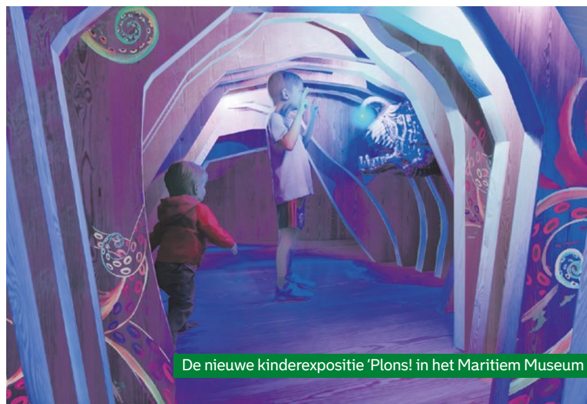
De nieuwe kinderexpositie 'Plons! in het Maritiem Museum