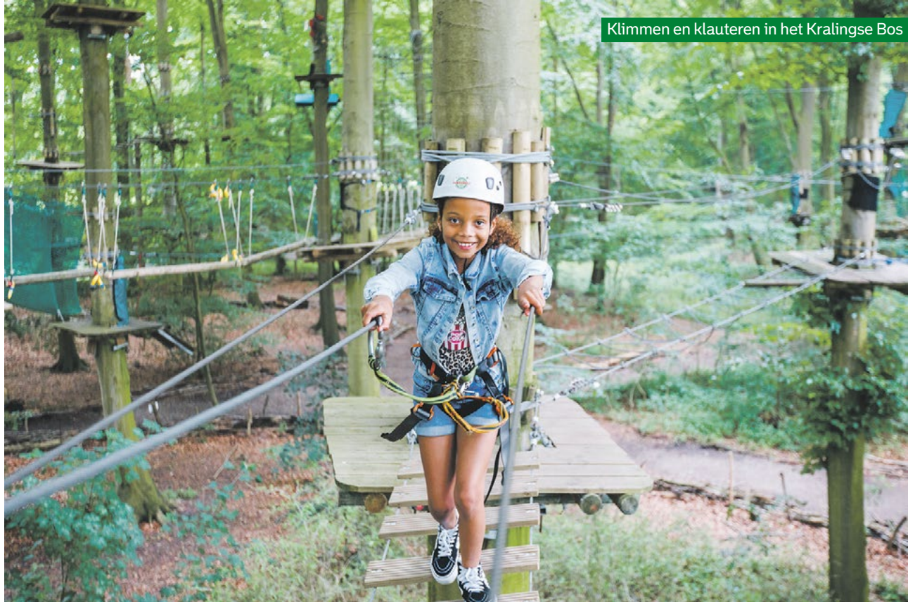
Klimmen en klauteren in het Kralingse Bos

Op zaterdag 26 oktober opent de nieuwe kinderexpositie 'Plons! De toekomst van de zee' in het Maritiem Museum. Spelenderwijs kunnen kinderen ontdekken dat ze zelf invloed kunnen hebben op hun wereld. Bijvoorbeeld door een zeeboerderij te bouwen, schone energie te maken, helpen de